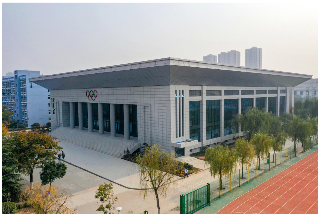
现代化体育馆高端恢弘