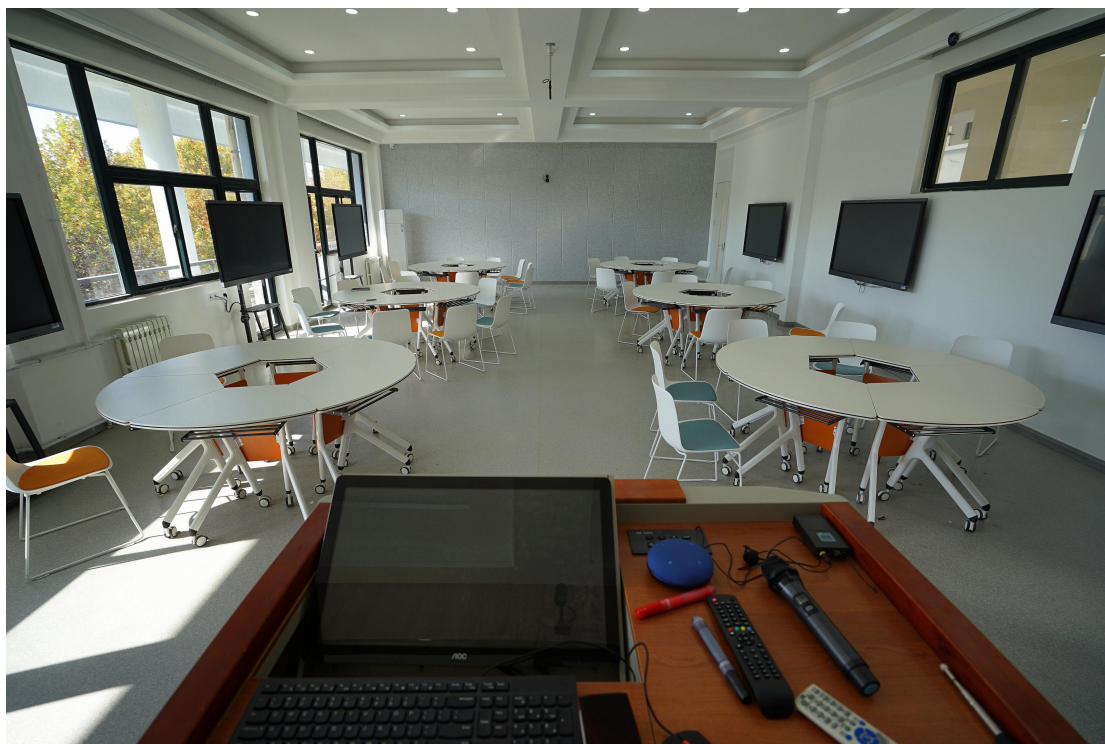
智慧教室高端一流